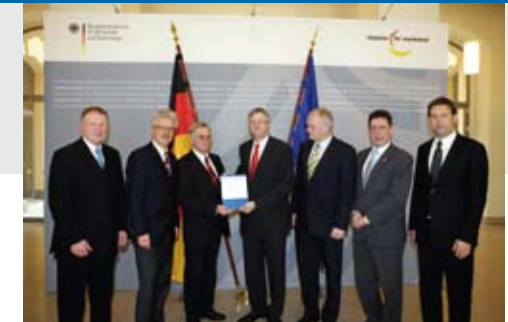
Übergabe des „Branchenbilds 2008“ an Staatssekretär Peter Hintze, Bundeswirtschaftsministerium

Ende 2007 bescheinigte der Unterausschuss des Bundestages der Wasserwirtschaft, dass sie die von der Bundesregierung beschlossene Strategie umsetze und damit einen wichtigen Beitrag für die künftigen Rahmenbedingungen leiste. Und Bundeskanzlerin Angela Merkel hob im Sommer 2009 die Bereitschaft der Branche hervor, sich einem freiwilligen Leistungsvergleich zu unterwerfen.